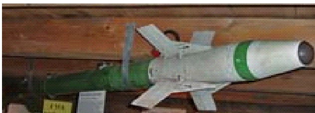
Jaktrobot RB 24J

J29, J32B, J34, J35A/B/D/F, AJ37, AJS37, SH37 och SF37