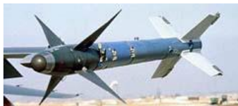
Jakrobot RB 74

J35D/F/J, AJ37, AJS37, SH37, SF37, JA37 och JAS39